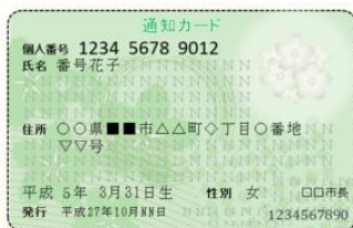
My number notice card